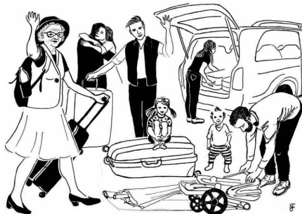
Illustration: Mag.a Ulrike Sellinger-Fleischmann für die Wiener Plattform Atomkraftfrei

Apropos das ganze Jahr: Wer möglichst regionale und nicht verarbeitete Lebensmittel (nicht nur im Sommer) isst, spart CO 2 und Geld!