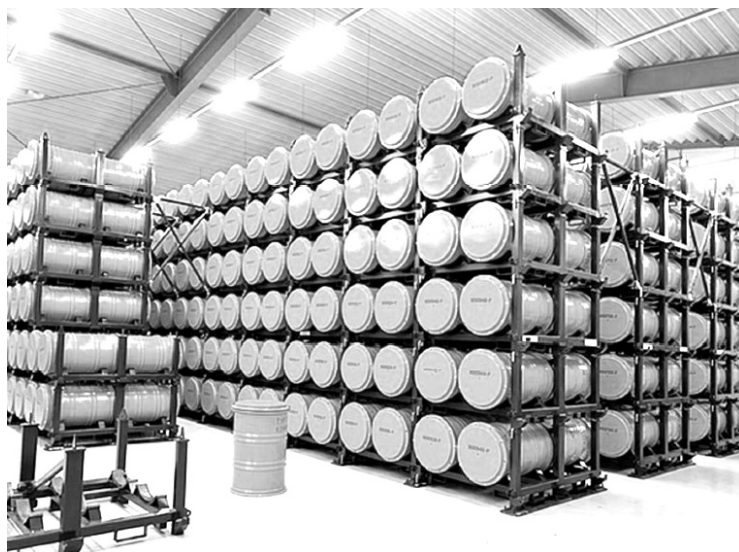
Die hier abgebildeten Fässer im Zwischenlager Seibersdorf sind im Großen und Ganzen das Volumen des zu entsorgenden radioaktiven Abfalls. Der Großteil davon ist in 200-Liter-Fässern abgefüllt, es gibt derzeit ca. 12.200 solcher Fässer. Der Großteil dieser Abfälle ist schwach radioaktiv und kurzlebig, aber ein kleiner Teil ist mittelaktiv und muss sehr lange sicher gelagert werden.

Das Ziel der Veranstaltung war es, Vorschläge und Ideen zu sammeln und in offener Diskussion mit dem Beirat zu erörtern. Die wichtigsten Fragen waren: Wie soll die Öffentlichkeit beteiligt werden? Wer soll über den Standort mitentscheiden? Soll es regelmäßige Bürgerkonferenzen geben? Soll es einen oder zwei Orte für das Lager geben, getrennt nach der Stärke der Radioaktivität? Wer entscheidet über die Art des Lagers? Die Strahlung müsste 2000 Jahre lang zurückgehalten werden. Wie kann das nötige Wissen um vergrabene Fässer so lange erhalten