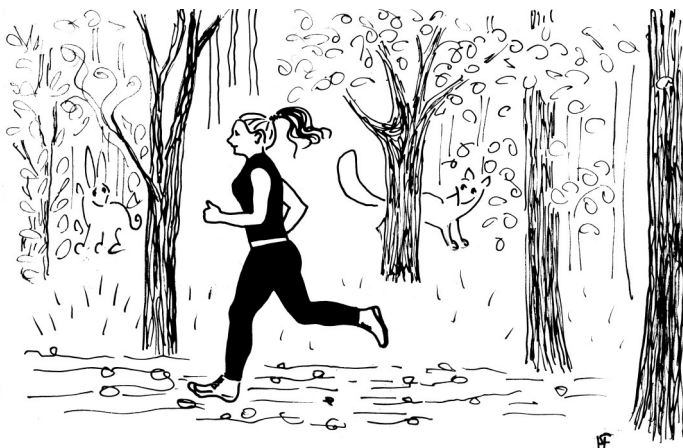
Illustration: Mag. a Ulrike Sellinger-Fleischmann für die Wiener Plattform Atomkraftfrei

Auch der Frühjahrsputz hilft, den Winter-Mief zu verjagen: zwei Teelöffel Natron, etwas Kernseife, frischer Zitronensaft und ein halber Liter Wasser – fertig ist der Allzweckreiniger für Bad oder Küche. Extra-Tipp: Mit einem Pinsel und/oder einem nebelfeuchten Geschirrtuch über elektrische Geräte (im ausgesteckten Zustand!) wischen: saubere, staubfreie Geräte laufen länger und effizienter!