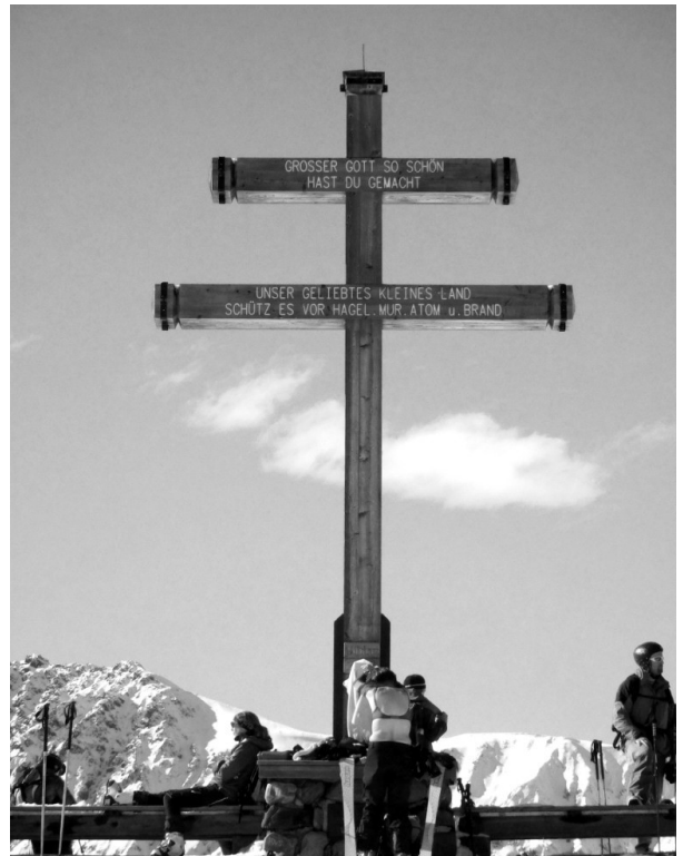
Eine unserer Aktivistinnen hat in Tirol dieses bemerkenswerte Gipfelkreuz gefunden und fotografiert. Es trägt die Inschrift „Großer Gott so schön / hast du gemacht / unser geliebtes kleines Land / schütz es vor Hagel, Mur, Atom und Brand“

Soeben erreicht uns die Nachricht, dass ein geleakter Bericht der Pro-Atomvereinigung WANO dem Reaktor 3 in Mochovce ein vernichtendes Zeugnis ausstellt: Von Rost, Schmutz, ungeeigneten Materialien und unsachgemäß durchgeführten Arbeiten an sensiblen Stellen ist die Rede und davon, dass von den dringend erforderlichen Verbesserungsarbeiten viele aufgrund der veralteten