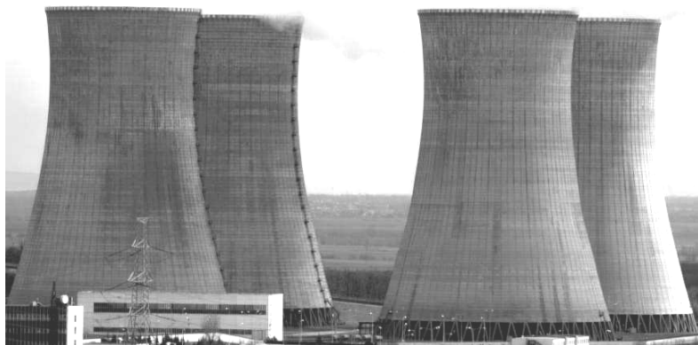
Das ungarische AKW Paks.

Im Umkreis von AKWs erkranken mehr Kinder an Leukämie; es werden insgesamt weniger Kinder