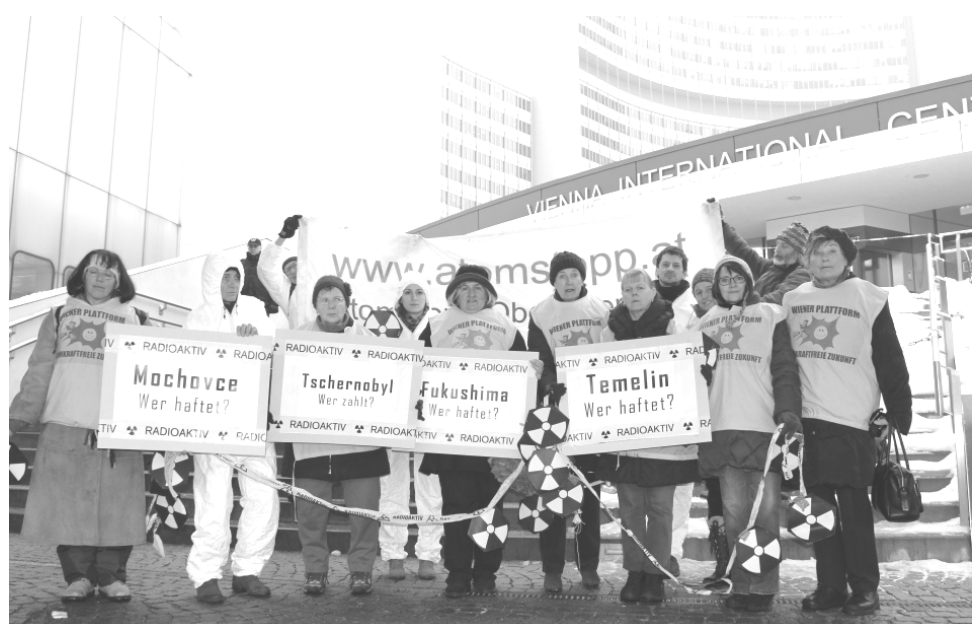
atomstopp_atomkraftfrei leben! und die Wiener Plattform Atomkraftfrei protestierten am 28. Jänner bei der Atomenergie-Tagung vor dem Hauptgebäude der Atomenergie-Behörde (IAEA).