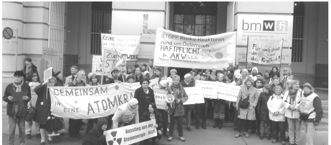
Kundgebung der Wiener Plattform Atomkraftfrei am Fukushima-Gedenktag vor dem Umweltministerium mit der Forderung nach einer einheitlichen Haftpflicht für alle AKWs in der EU.

Österreich sieht, dem Umweltministerium zufolge, seine Rolle in diesem Prozess hauptsächlich darin, die Umsetzung der Empfehlungen der ENSREG in den Nachbarstaaten zu beobachten („Monitoring“).