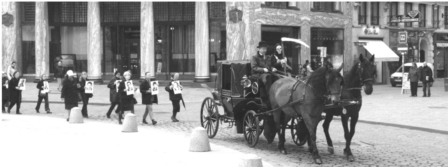
Der Trauerzug der Wiener Plattform Atomkraftfrei für die Liquidatoren mit dem Tod auf dem Kutschbock war ein eindringliches Bild! Bericht auf Seite 2.

Die Katastrophe von Fukushima ist eine Aufforderung, unseren Umgang mit (elektrischer) Energie zu überdenken und neu zu ordnen. Oder brauchen wir dazu noch ein nukleares Desaster?